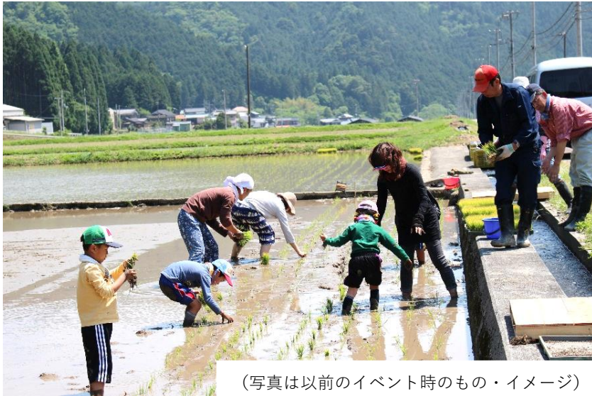
(写真は以前のイベント時のもの・イメージ)

体験する機会が少なくなった田植え体験。一つ一つ苗を植える作業を通じて、農家さんの大変さを学ぶとともに、食への感謝の気持ちが育まれます。神河町は名水の町。神河町で植えたお米が美味しく育ちますようにと願いを込めて、一緒に田植え体験をしてみませんか？